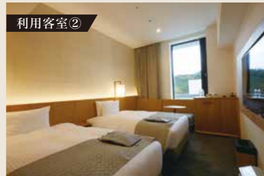
②ツインルーム(定員3名・禁煙)森林側(イメージ)

ご利用料金 1泊朝食付き グループ宿泊料金 ※詳しくは下記カレンダーをご覧ください。