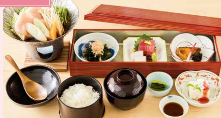
小鉢・お造り・焼魚・鍋物・お食事(ご飯・香の物・味噌汁)・甘味