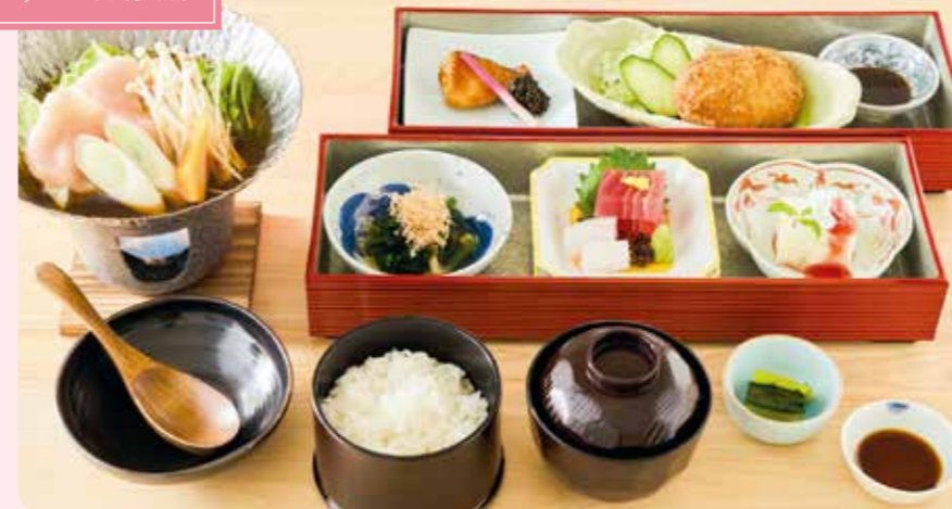
小鉢・お造り・焼魚・三島コロッケ・鍋物・お食事(ご飯・香の物・味噌汁)・甘味