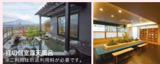
貸切個室露天風呂 ※ご利用は別途利用料が必要です。

温泉大浴場：【男性用、女性用共通】露天風呂 2、内湯 3、水風呂 1、サウナ 1 貸切個室風呂：19 室(21～60 ㎡) 泉質：ナトリウム - 硫酸塩・塩化物・炭酸水素塩温泉(弱アルカリ性) 利用時間：10:30～最終受付 21:00(22:00 終了) グループ料金：平日 大人(中学生以上)通常 1,600 円→1,300 円 土・休日 大人(中学生以上)通常 1,900 円→1,600 円 ※料金は諸税・バスタオル・フェイスタオル代を含むお一人様料金です。 ※3歳未満のお子様の温泉大浴場の利用は、お断りしております。 ※刺青・タトゥー(シールペイント含む)のある方の利用は原則お断りいたします。 ただし、当店指定のカバーシール(有料)2 枚で隠せる場合は利用可能。隠せない 場合やシールをご利用いただけない場合は入館をお断りさせていただきます。