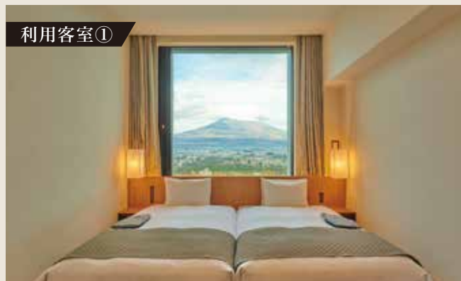
①富士ビューツインルーム(定員2名・禁煙)(イメージ)