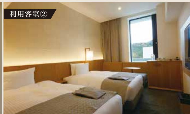
②ツインルーム(定員3名・禁煙)森林側(イメージ)

※料金は客室①または客室②のお部屋で1室2名様ご利用の一人様料金(夕食・朝食・消費税・入湯税が含まれます) ※タ・朝食ともにビュッフェスタイルにてご提供いたします。(1泊朝食付きの場合、右記料金より5,000円引き) ※料金は変動制となります。上記料金は参考料金となりますので、都度ご予約時にご確認をお願い致します。 ※大人10名様よりご予約を承ります。 ※チェックイン15:00 チェックアウト10:00 ※キャンセル料は一人様につき、14日前10%、9日前30%、3日前50%、前日100%頂戴いたします。 なお、宿泊条件により別途キャンセル料を設定させていただく場合がございます。