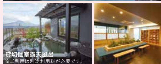
貸切個室露天風呂